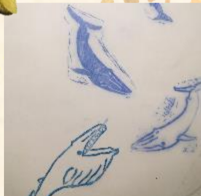
クジラスタンプ のハンカチ