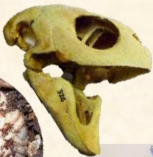
ウミガメの 頭骨標本