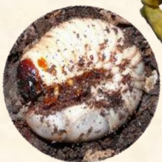
カブトムシ幼虫 (いもむしランド)