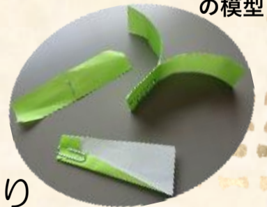
空飛ぶタネ の模型