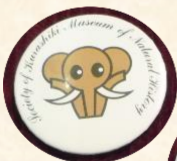
オリジナル 缶バッジ