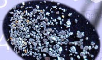
イリジウム (Ir) オスミウム (Os) イリドスミン