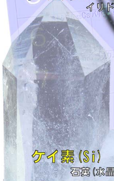
ケイ素 (Si) 石英(水晶)