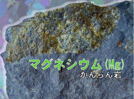
マグネシウム (Mg) かんらん岩