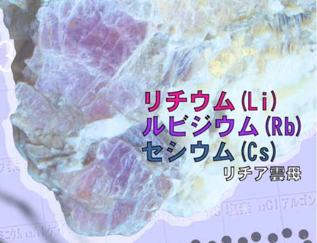
リチウム (Li) ルビジウム (Rb) セシウム (Cs) リチア雲母