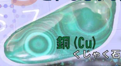
銅 (Cu) 孔雀石