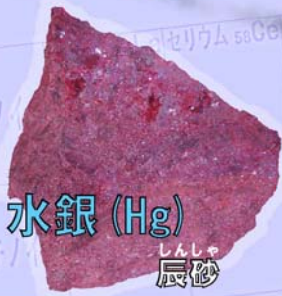
水銀 (Hg) 辰砂