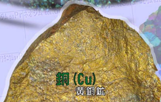
銅 (Cu) 黄銅鉱