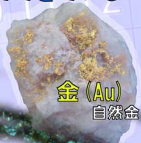
金 (Au) 自然金